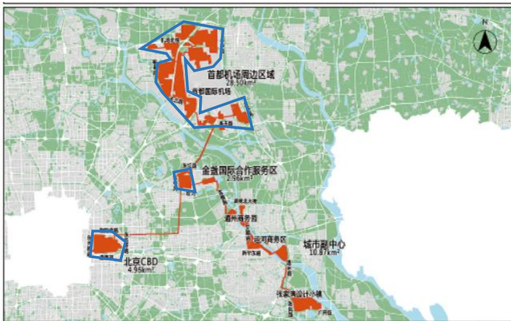
图 3 国际商务服务片区位置关系及区域评估范围

其中北京市城市副中心区域已完成北京市地质灾害危险性区域评估，因此本次扣除已完成区域，其他区域约 35.42 平方公里纳入 2024 年地质危险性区域评估范围，该区包含已建城区（金盏国际合作商务区及北京 CBD 合计 6.92 平方公里）及规划建设区（首都机场周边区域 28.5 平方公里），其中规划建设区 28.5 平方公里作为重点调查区，见图 3。