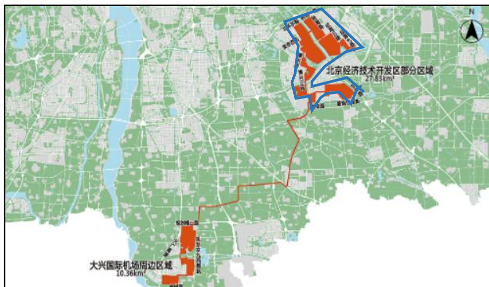
图 4 高端产业片区位置关系及区域评估范围